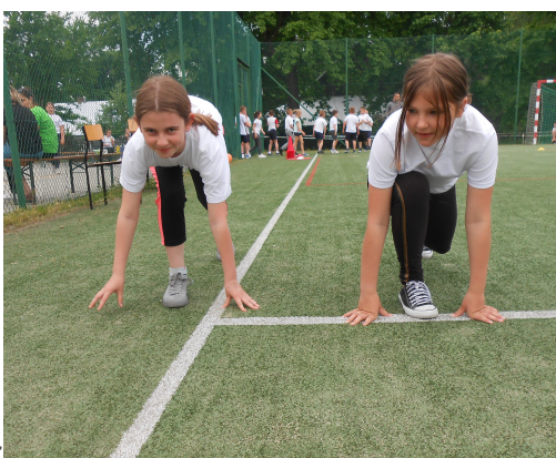
katęgoria klasa I:

Uczniowie z naszego zespołu rywalizowali w czterech kategoriach - osobno chłopcy, osobno dziewczęta. Ich zadaniem było przebiec określoną trasę z przeszkodami. Wyniki rywalizacji przedstawiały się następująco: