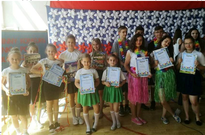
klasy IV-VI SP: